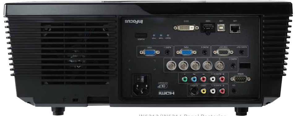
IN5312/IN5314 Panel Posterior

Los 4000 lúmenes del IN5314, IN5316HD y el IN5318 proyectan imágenes nítidas y definidas aún en ambientes iluminados. Pero si requiere aún más brillo puede adquirirlo en el IN5312 con 4500 lúmenes. Su diseño de una sola lámpara lo hace económico y de fácil mantenimiento.